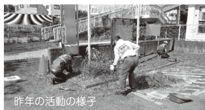
昨年の活動の様子