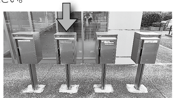
左から二番目がセンターのポストです。

サテライト施設を八王子市生涯学習センター（クリエイトホール 八王子市東町5番6号）地下1階に開設する予定ですが、八王子市の令和7年度予算によるパーテーション工事等が必要であるため、5月以降の開設となります。詳細については、別途お知らせします。