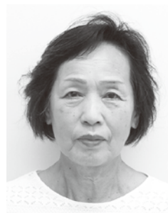
国里比名枝 新理事