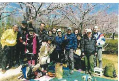
陵南公園での楽しいひと時

4月3日、陵南公園で有志による花見をおこないました。今回の花見は高尾山を登る会に参加した時、突然山頂に