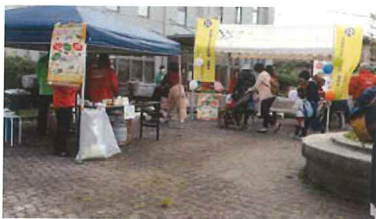
10月 ここにこフェア