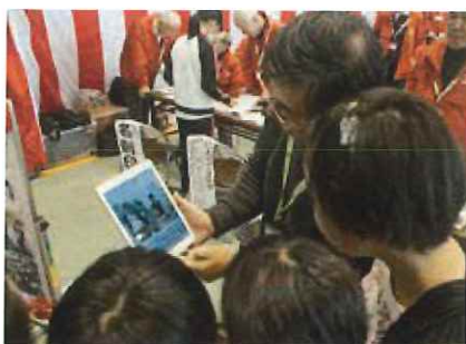
技能祭でITを用いてお客様にご説明

②ホームページはタブレットやスマホの普及に伴い、これらへの対応が必須となっています。私たちは、ホームページの制作や、作り方のご指導を行います。 ③お助け隊はパソコンのトラブルを解決します。お宅にお伺いして目の前で直す訪問サポートと、3か月に1回大横保健福祉センターで無料相談会を実施しています。 ④SNS部会は、シルバー所有のタブレットを使って、タブレットの基礎操作をはじめ、LINE、FACEBOOKなどのSNSを安全に楽しく使って頂くための講座を開講します。