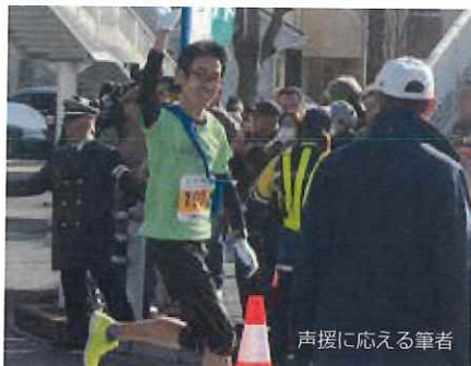
声援に応える筆者

2月10日、八王子夢街道駅伝に友人3名と出場し、2区を走りました。シルバー人材センター会員の方々がボランティア活動で協力している大会です。沿道から数名の会員さんの応援を受け、何とか粘りの走りことができました。あり