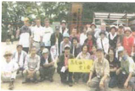
高尾山頂上での記念写真

昨年12月11日、本日の参加者28名が高尾山口駅に集合し新会員およびゲスト参加者の紹介があり、登山口の清滝駅の前で恒例の準備体操の後、保養院の脇からいつもの通り1号路へと向かい途中で小休止。その後1号路を通り薬王院の脇から3号路へと進み山頂を目指し、山頂では昼食をとったあと、ビンゴゲームをワイワイ・ガヤガヤいっになく真剣な面持ちで楽しんで