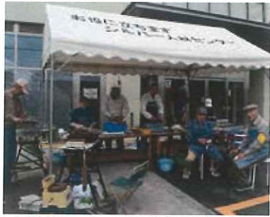
大横保健センターでの刃物研ぎ就業のようす

今まで大工職人として現役で活躍された2人のベテラン親方が中心に活動してきましたが、正式な委員会班組織でなく10数年が経過してきました。