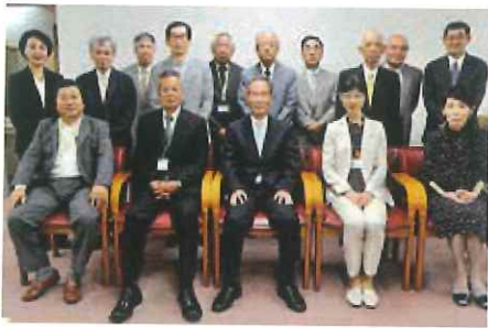
決意を新たにする、新理事・監事の面々