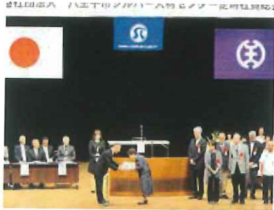
高部会長から表彰を授与される会員