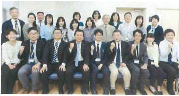
誠心誠意をもって取り組む職員一同