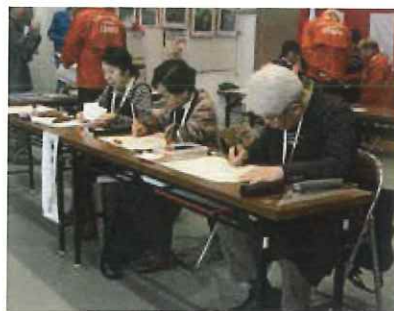
技能祭での筆耕実演のようす

シルバー人材センターに入ってよかつたことは、書に興味を持つ同じ思いの人に巡り会え、共に研鑽していく喜びに出会えたことです。シルバーの一般書道の教室では、筆を常に持つ毎日の鍛錬の大切さを学びました。実用書道の教