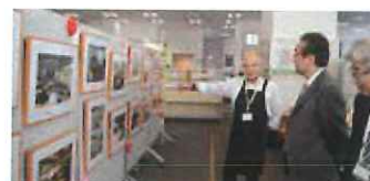
10月 いきいき活動展