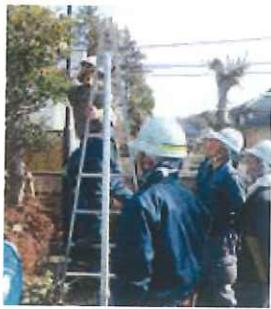
技能研修会の1コマ

1月号では植木班の概要について紹介しました。要約すると、①お庭の剪定を主に行う。②職人仕事なので一定の経験とスキルが必要。③このために300時間の見習い期間があり、検定に合格すれば親方資格の一般会員になる。(就業単価もアップします)④お客様からセンターに注文が入ると担当の親方が指名され、下見、見積り、作業員の確保、作業日の確定、作業のすべてを担当する。⑤植木剪定に必要な脚立やハサミなどは原則個人持ち。