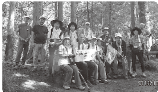
（第19回高尾山ハイキング）