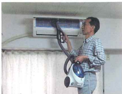
すみずみまできれいに清掃

シルバー会員になって、駐車場管理、家事援助、広報配布を行っている中で、家事援助は殆どが単独行動です。下見に行ったり、業務内容に応じた準備等大変ですが、それにも増して人との出会いが生まれ、交流できることは会話が少なくなっている現在、喜びであり、楽しみです。依頼された仕事以外にも、健康を害するような物(カビ、菌、ほこり)の除去、清掃等を依頼主に提案し、相談しな