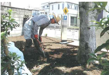
除草は苦勞した分、達成感や満足感が味わえます

現在委員を受けて色々な問題に取り組みながら少しでもより良い方向を目指して仲間と共に日々葛藤しながら、前進していきたいと思えます。