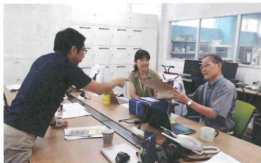
用務員の仕事は大変ですが遣り甲斐があります

勤務は平日の9時30分から15時30分の実働5時間で会員2名が交代で行っています。職場は、女性の方々が大変活躍されておられます。当方も皆様から元気をいただきながら業務に励んでおります。