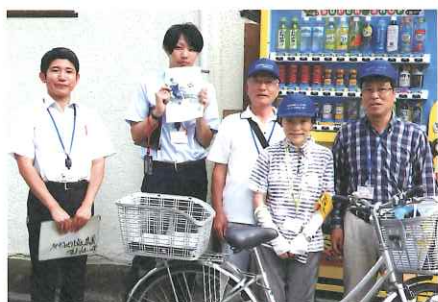
広報課職員(左の二人)が配布の見学、労をねぎらっていただきました。(中央が筆者と配布員)

新人への指導は2回行い、2回目には市役所の広報課職員が見学に来てくれました。市の方にも現場の苦勞を良くご理解いただけたいと思えます。