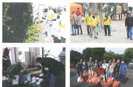
市施設植木除草、いちよう祭り清掃、地域清掃 夢街道駅伝の各ボランティア (昨年度の参加より)

私の周りの会員の相当の人達はシルバー人材センターが就業を紹介してくれ、紹介した就業に参加しているのであってボランティア活動については興味が無い、知っているが参加したくない等という考えが実態のように思われます。ボランティア活動の理解者を増やすには「助け合い・お互いさま」をキャッチフレーズとしてこの言葉を思いつきました。私が家庭菜園で一緒に先輩は度々アドバイスや収