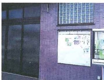
町会の掲示板に当センターのポスターを貼らせていただいた

5月後半に逢うことが出来、町会が保有している掲示板にシルバーの募集パンフを貼ってほしい旨をお願いしたところ快く受けて頂きすでに左記写真の様な案内をして頂くことに成り今や他に6地区の町会を紹介頂き順次広げていければと願っています。