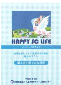
第3次中期5力年計画冊子 (平成30年4月～)

した。又、多数の委員会、職種、地域班の構成など、多くのことを学ばせて頂きました。そしてこの度、北部理事を務めさせて頂くことになりました。今後、これまでの経験を活かしつつ、これまで以上に会員の皆様のご意見、ご要望をできる限りシルバー人材センターへお届けすることが出来そうですよう努力して参りたいと思っておりますので、ご指導・ご協力のほど宜しくお願い致します。