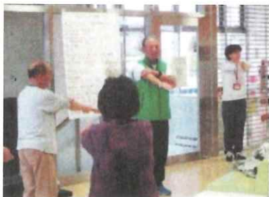
健康づくりサポーターと一緒に おおよこ毎日体操の様子

大横保健福祉センター1階の交流スペースでは、平日月曜日から金曜日まで9時30分から9時45分ごろまで「おおよこ毎日体操」を行っています。来館された方々みんなでレクリエーションを兼ねたストレッチをして体と心をほぐします。日によってメニューは変わりますが「ラジオ体操」をはじめ、「武田節の体操」や歌に合わせて「八王子けんこう体操」を行っています。