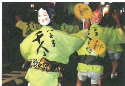
被写体を求めて歩き回る 写真撮りは健康の源

しばらくぶりに会った友人に「どうだい調子は」と聞かれることはよくある。「最近元気ないよ」から「快調々々」まで、たくさんある答えの中で、マイナス側にいくことが多くなってきた。そんな時、「元気の秘訣を書けと言われ、更にストレスが増えた。ストレスって何だろう。悪玉コレステロールみたいだ。では善玉は何という？それはリラックス」ということになるのか。我を忘れて打ち込めるなにか、その様なものを持つことを薦めるケースも多い。この辺り