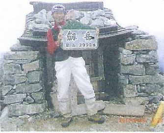
100名山の1つ剣岳に登頂、勇気と希望を得たひと時でした。