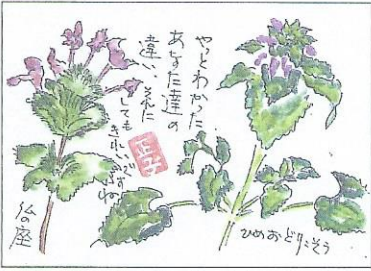
道端や庭先で見かける花、ともにシソ科の仲間。絵をかくて違いがわかる。

あきる野市酒造場が製造している。今は休蔵中だが、八王子恩方の酒造場の陣馬山、桑乃都という酒もあった。