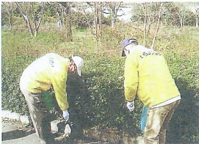
いちよう祭り清掃ボランティアも参加しました。