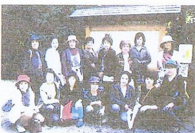
秋の散策でリフレッシュしながら、会員どうしの絆が深まりました。

情報の共有化を図る事ができ今 後、顧客情報の基礎データとし て活用出来る素地を創り上げ る事が出来ました。改めて会 員、事務局員の皆様の御支援に 感謝致します。さて就業開拓活 動の過程で様々な問題点も見え て来しました。特に大きなものは 「需要」と「供給」のミスマツ チです。即ち、顧客の求める仕 事の内容と会員の希望する仕事 の内容にズレが生じていると言 う事です。この事が根本的に就 業率の低下を招いています。ワ ークシェアリングの施策等に対 策は打たれていますが会員の平 均年齢の上昇に伴い今後センタ ーとしての顧客への対応力と共 に、会員の希望職種に関する柔 軟な運用(調整、見直し等)と それに基づく受注活動への反 映、新規事業の創出等を現実に に考えて行く必要が出て来い ると思えます。