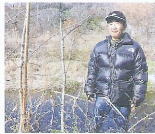
四季折々の風景もウォーキングの楽しみ。(北浅川にて)

ですが、お陰様で毎年の健康診断の結果はオール5で健康そのものです。これからも体の許す限り無理をせず続けたいと思っています。