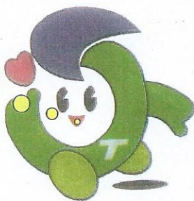
シルバー人材センターマーク「シルバーくん」

世帯も近い人達を通しての話や、地域のこと、また家庭のこと、健康のこと等色々あります。現役を去る時期にはこれらの日々をどの様に過ごすか悩んだこともありましたがどの様なことでも良いから世の中や地域に係って生きていくことが大切なことではないかと思えます。シルバー人材センターでの仕事、人々との係わり地域団体への参加やボランティア参加により充実の日々を願い前向きに頑張っていきたいと思えます。