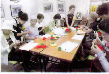
オープン式典で市民の皆さまに手づくりグッズ作製の指導をするきさらぎ班

食堂が無い、駐車場が無いのは残念ですが4階の料理室は広くて料理を作る意欲をそそります。子ども教室、お母さん教室、おばあちゃん教室そして男性厨房に入るとおおいに男性料理の腕を上げて貰いたい。等楽しみが夢のように湧きあがります。1階のパン売り場も談話室まで好評です。あそこで日頃の鬱憤を晴らしつつも混み混みに成るといいですね。地下のプールでは水中歩行だ