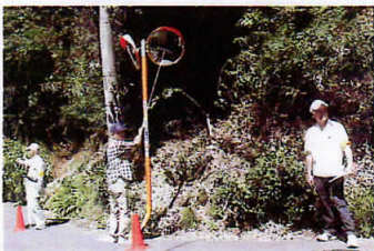
安全確認2人と清掃作業、 連携プレーで事故防止

新しい施設は明るく綺麗でエレベーターもあり3階のシルバークラスセンターに行くにも便利に成りました。色々な施設が入っているのが相互に協力し合える事があれば、より発展していけるのではないかと期待しております。駐車場が早く出来ればより利用しやすく成ると思います。