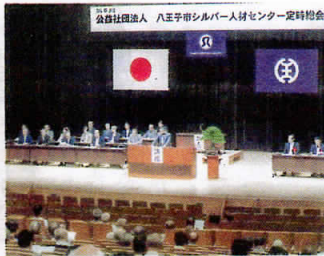
盛大に開催された第5回定時総会