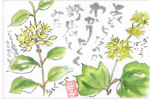
誇張してわかる植物の種類

とるでもあります。とはいえ秩父往還や正丸峠越えで江戸との交流も多く、秩父歌舞伎などにみられるように、先進文化を取り入れ醸成された固有文化を育んできたのではと思います。巾着の入り口近くには石畳で有名な「長瀬」があり、奥には雲取山に続く地に三峰神社が、中心地には秩父神社が鎮座しています。日本三大曳山祭りとし