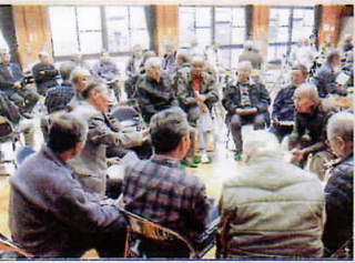
会員同士で気楽に話ができ有意義な一日でした(昨年の南部地区のようす)

タウンミーティングは、今年度3回目になりました。今年度も(中東西南北)地区ごと(9月以降)に開催いたします。会員の皆様、SCCの事業に口頭抱いている疑問・提案を、お互いに話し合う良い機会です。ぜひ参加して同じ地域の会員同士、お互い顔が分かる関係を増やしてください。(地域委員会)