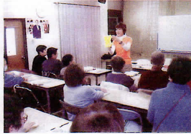
「家事援助マナー・技能向上」の研修会のようす

お客様のご在宅の中での仕事です。ご依頼に即対応できるには、家事援助希望の会員さん