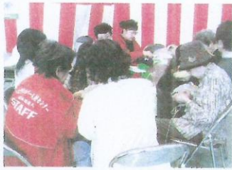
熱心に指導するきさらぎ班

毎年参加している、東京都立多摩能力開発センター八王子校主催の技能祭に広報委員会きさらぎ班