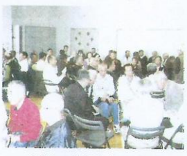
班別にて情報交換のようす

事務局からSCの公益性、自主・自立、共働・共助の再確認、ワークシェアリングの必要性等の説明がありました。就業機会を得る為には自身の努力・技術の向上・協調性・専門知識の向上等が必要と痛感した。ボランティア、イベント参加の願いがありました。地域に貢献できる良い機会です。また、体力維持、健康維持、色々な方と交流や出会いも期待できるの積極