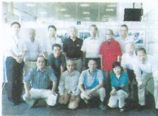
裏方を支えた実行委員の皆様

去る9月11日、19日迄サザンスカイタワー4Fにてセンター祭りとして、就業、ボランティア活動の写真パネル展示を行いました。 一般市民に知名度アップ及び就業拡大につながる有意義な催しとなりました。高齢者の無心に働く姿は美しい！感動を呼ぶ立派なPRにつながりました。また、きさらぎ班苦心の記念品も大変好評でした。植木班、除草班、大工、管理、表装班、パソコン班、配布班、筆耕、広報等多岐に亘る職種から実行委員が選出