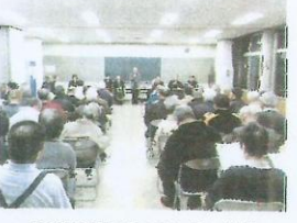
真剣に耳を傾ける会員の皆様

意見を出し合ってお互いを理解することは非常に有意義なことであり、今後もこのような機会を是非つくって頂きたいと思いをしました。