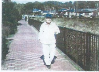
今日も楽しくウォーキング

ウォーキングの醍醐味は、季節によって感じ方は違いますが、目や耳から入るもので、自然の素晴らしさ、普段気が付かなかった新しい発見等があり、楽しみながらやれば長く続けられます。注意しなければいけない事として、夏の熱中症対策や歩く前のストレッチ等の準備運動を忘れない事とやり過ぎや無理も禁物です。いくら健康に良くても最悪の事態になりかねません。