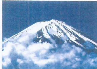
世界遺産になった富士山

最初の試し撮りは高尾山の斜面、中央道の工事現場です。今では貴重な記録になりました。当時のカメラはフィルム装填、巻上げ、露出、シャッター速度、ピント合わせ等、全てが手動でした。所がデジタルカメラで革命が起こりました。チャンスに出会った時にはすぐ撮れて