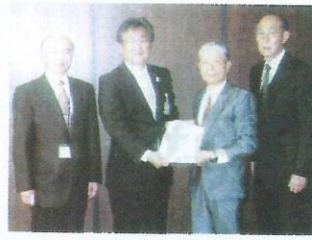
支援要請後の記念写真

八王子市の幹部に対し毎年行っている当センターへの支援要請及び事業発注のお礼を行いました。例年は8月に訪問していましたが、今回は市の組織変