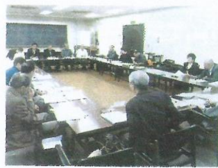
委員会で議論する委員の皆様

らぎ班として小物作りの実演を行いました。短時間で出来上がり実用的で色とりも綺麗なアクリルタワシを選びました。興味のある方がそれぞれの色づかいで楽しく編んで下さりお持ちいただきました。よほど汚れがないうれし洗剤に環境にも優しいアクリルエコータワシです。気に入って下さるたでしょう、か、思いのほか大盛況で嬉しい事でした。