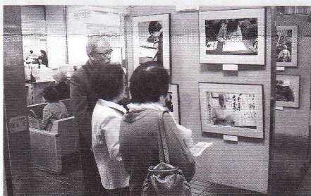
会員の説明でより分かりやすく

広報委員会の皆様ありがとうございました。ご来場いただきました会員の皆様ありがとうございました。