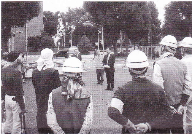
市民部長さんから激励が