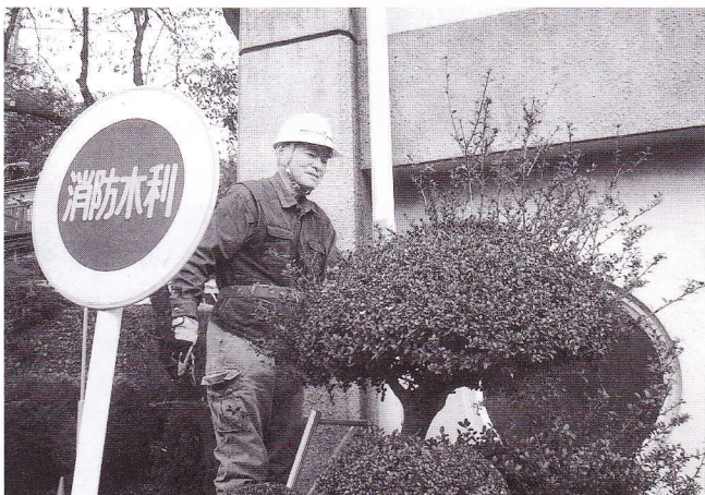
館事務所もきれいに