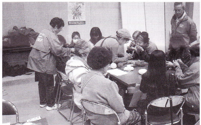
きさらぎ班の手作りの品は女性に人気